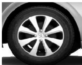
Embellecedores 15" Iridium Eco