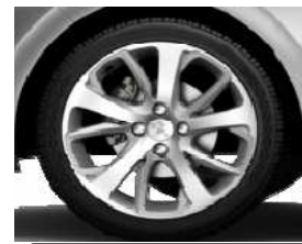
Llantas aleación 17" Oxygène Héphaïs