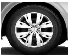
Embellecedores 15" Chrome