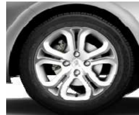
Llantas aleación 16" Hélium Blanco Banquise