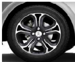
Llantas aleación 16" Hélium Técnico Grey