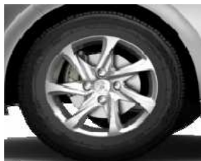
Llantas aleación 15" Azote