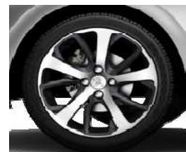
Llantas aleación 17" Oxygène Técnico Grey