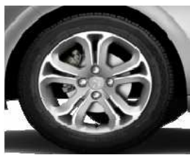
Llantas aleación 16" Hélium Héphaïs